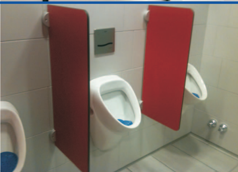
PLATTENDEKORE IM STANDARDPROGRAMM CT - 13